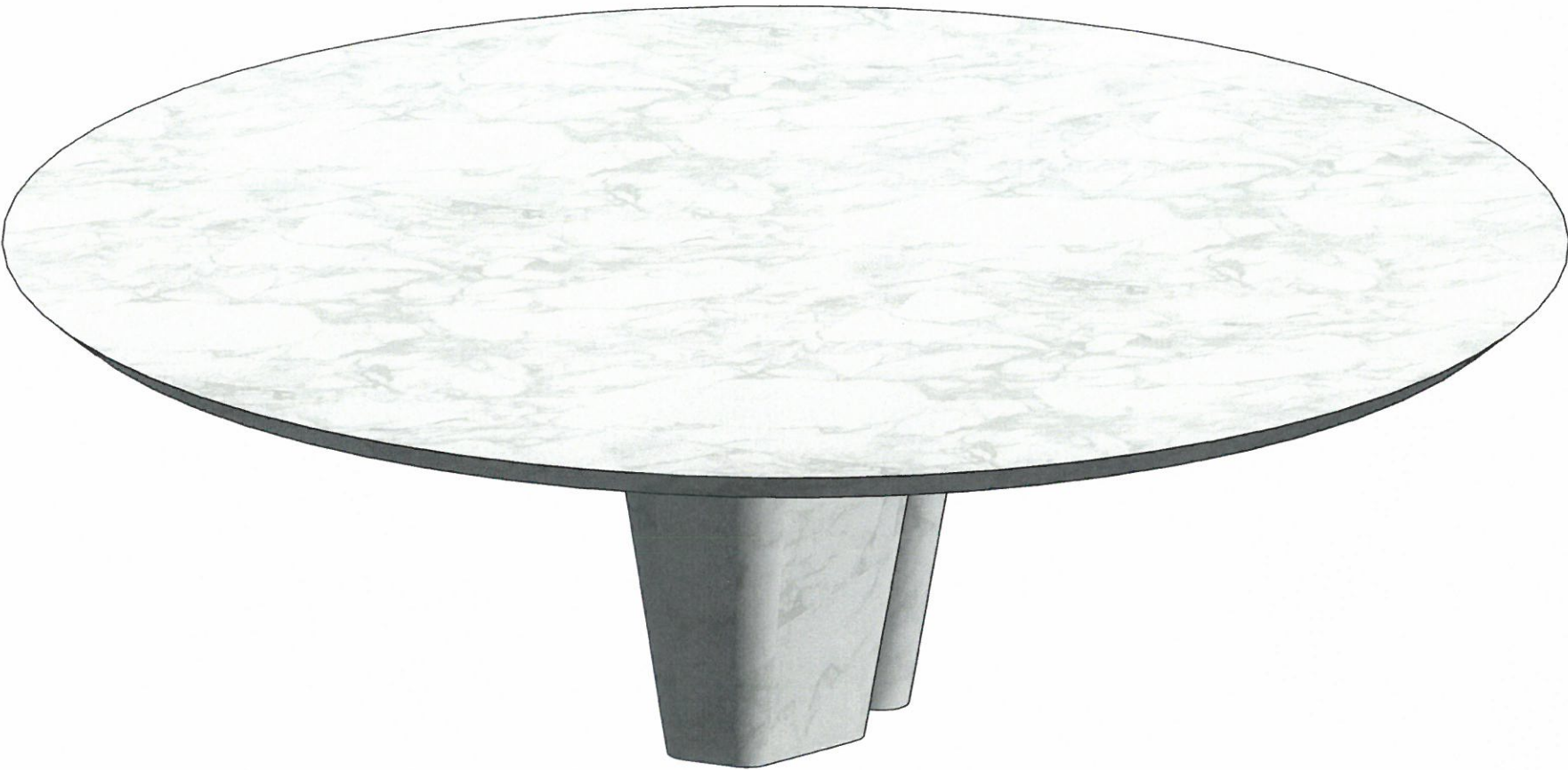
Вид сверху 1 : 25